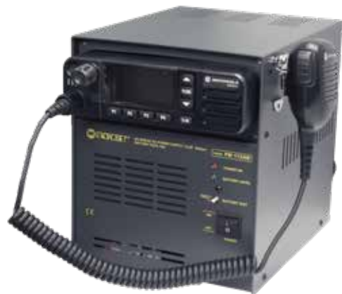
Utilizzo tipico Typical use