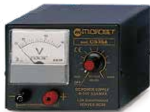
CS35A Out 0-15V 3,5A