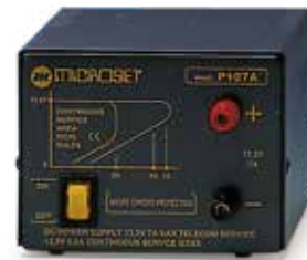
P 107A Out 13.5V 7A