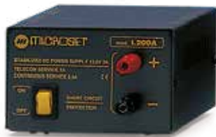
L 200A Out 13.5V 2A