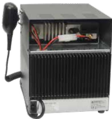
Vista retro Rear view