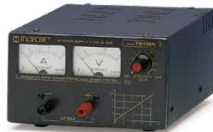
PS 105A Out 0-15V 5-6A